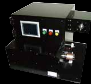
●シングルヘッドタイプ BW-RW1